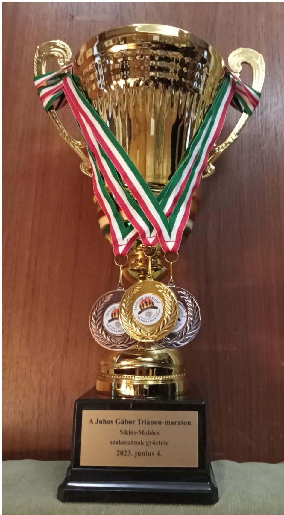
A minden versenyszámban kiosztásra kerülő arany-, ezüst- és bronzérem, valamint Trianon-maraton győzteseinek (férfi, női, csapat) járó serleg